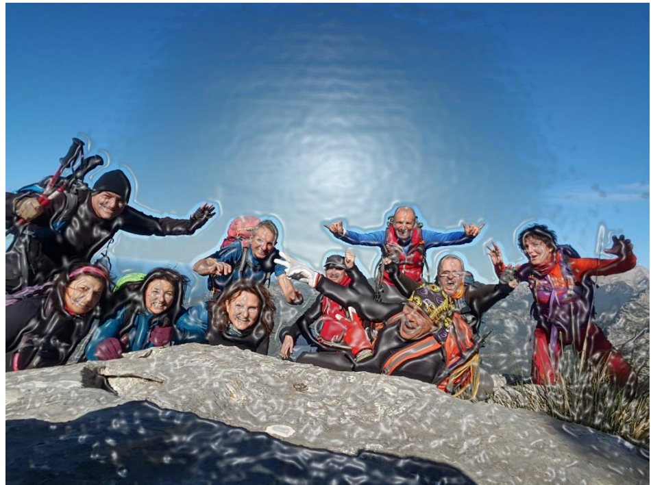
Kabretes sense por!