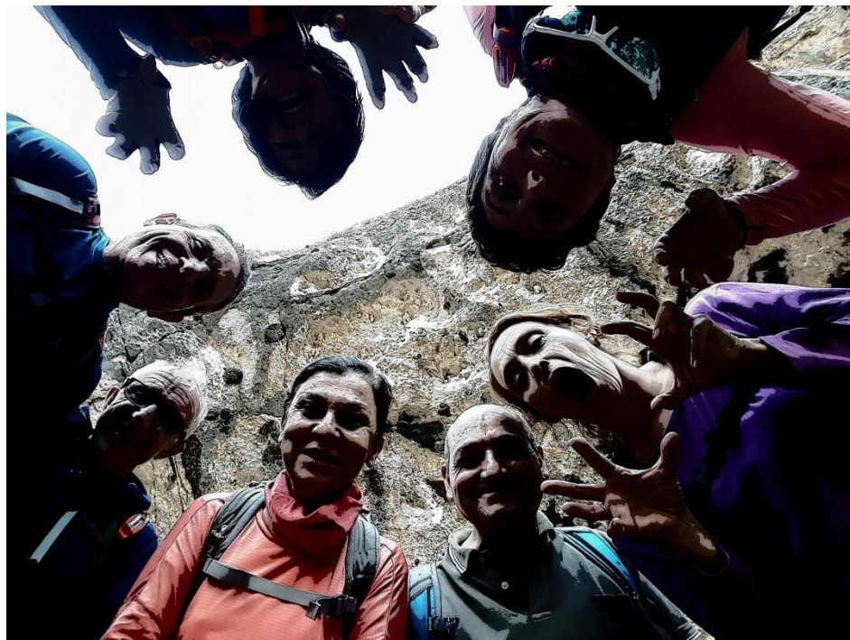
Kabretes sense por!