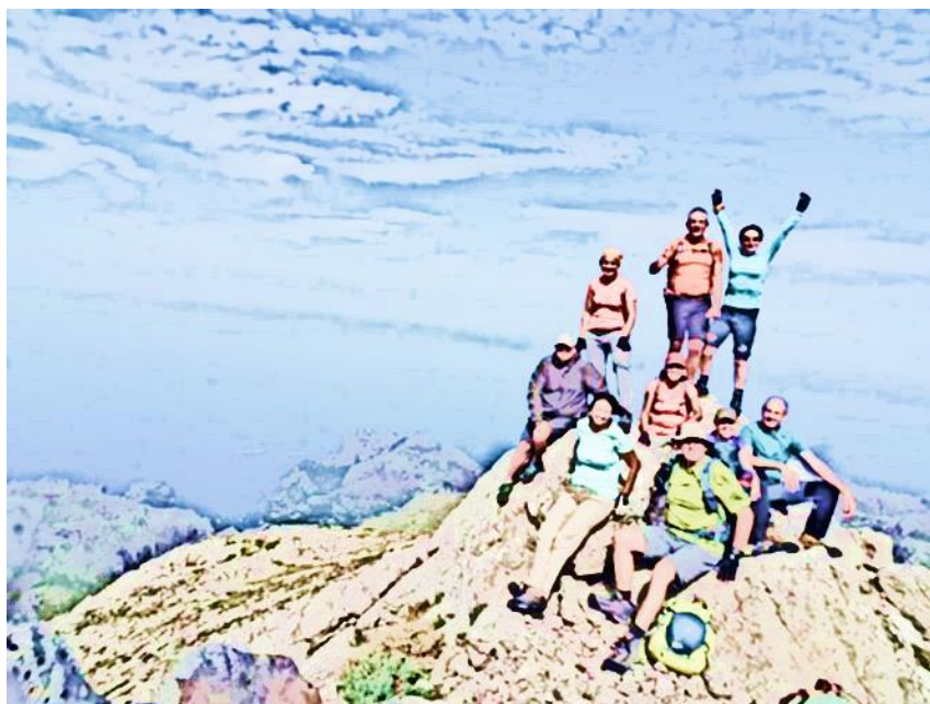
Kabretes sense por!