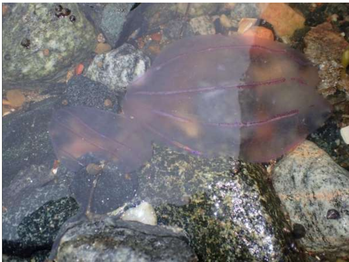
La única causa que no va permetre el bany...