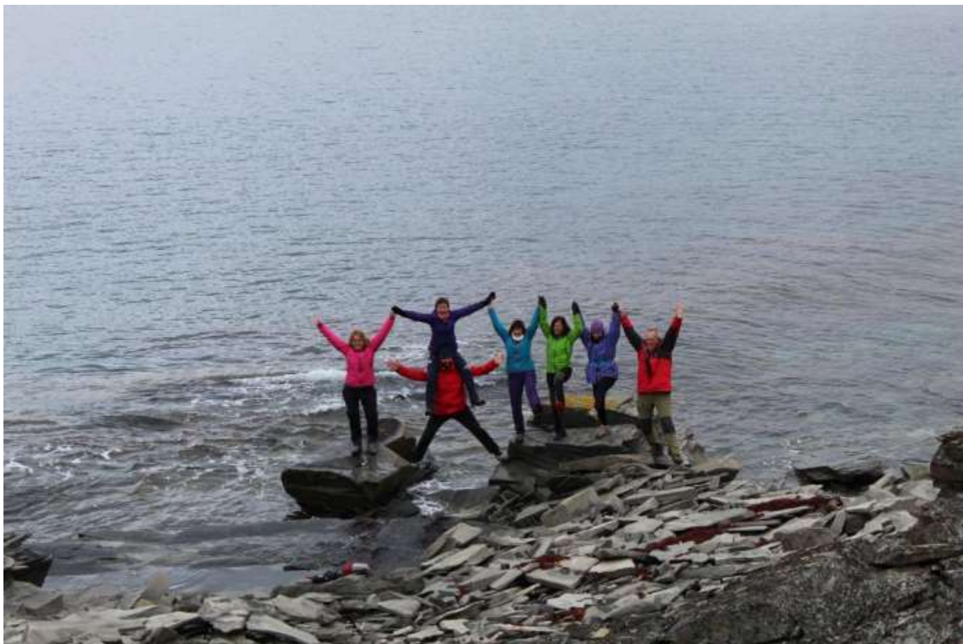
Bugoynes, la platja rosa i el lloc amagat