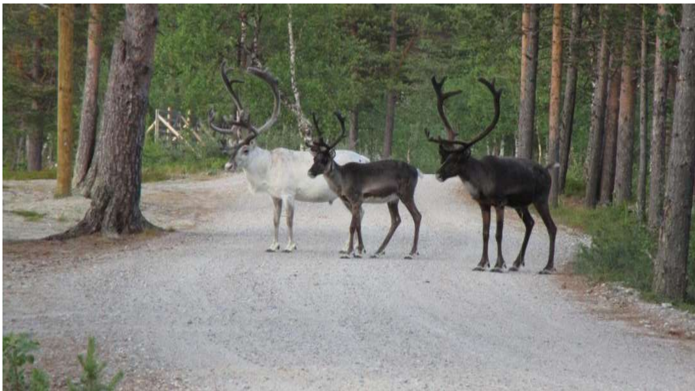
Inari: el personal fines en majúscules