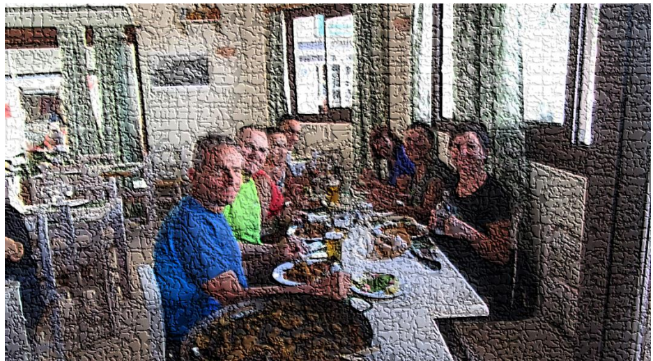
Kabretes sense por!