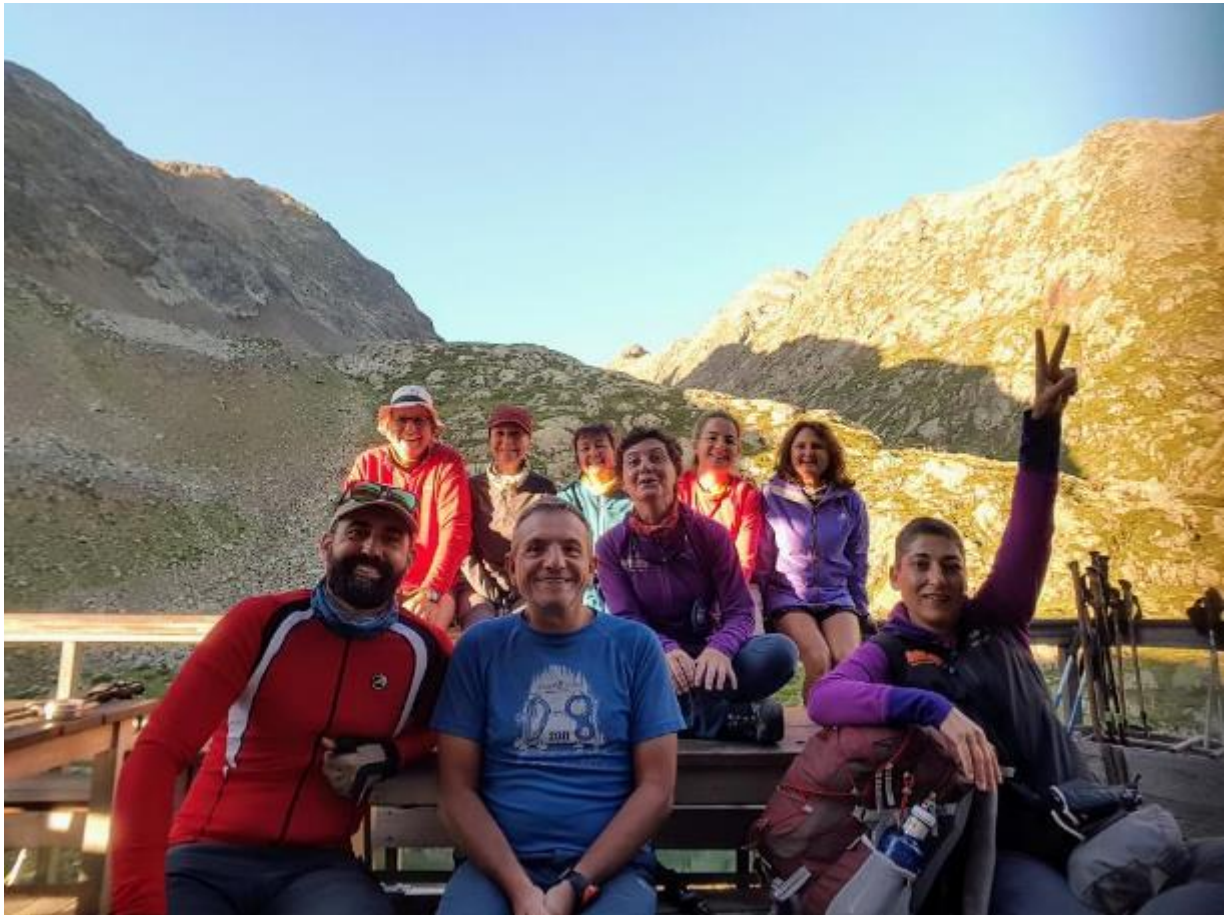
Uiii ses carettes que ja canvien !