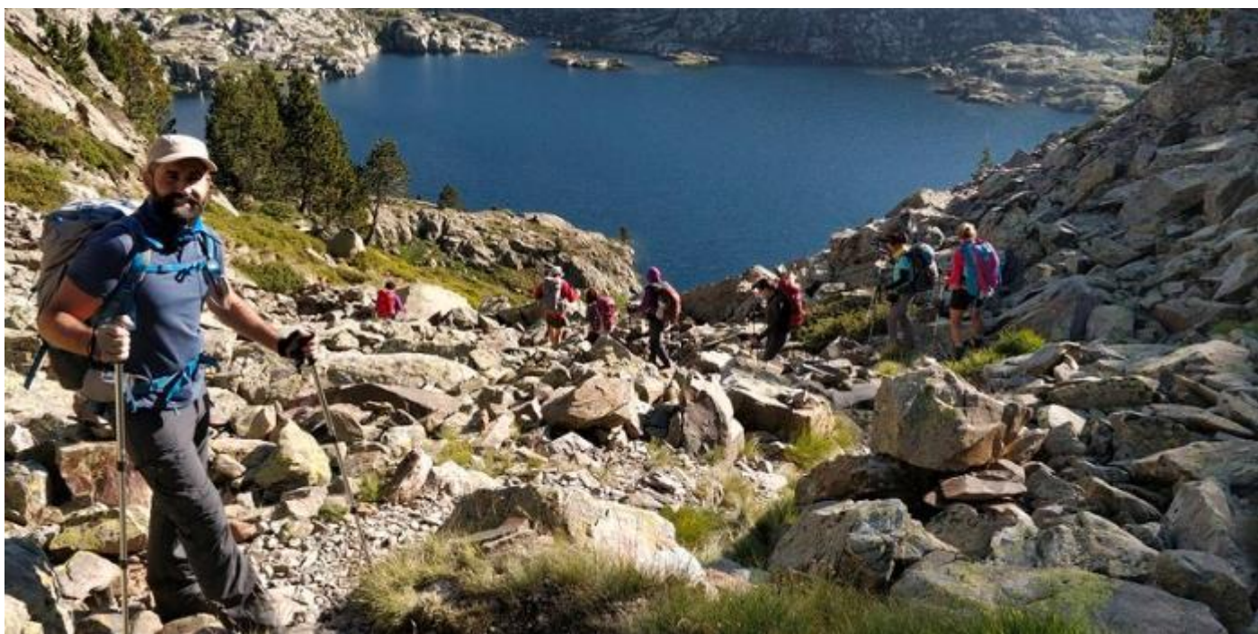
Dia llarg i clar...