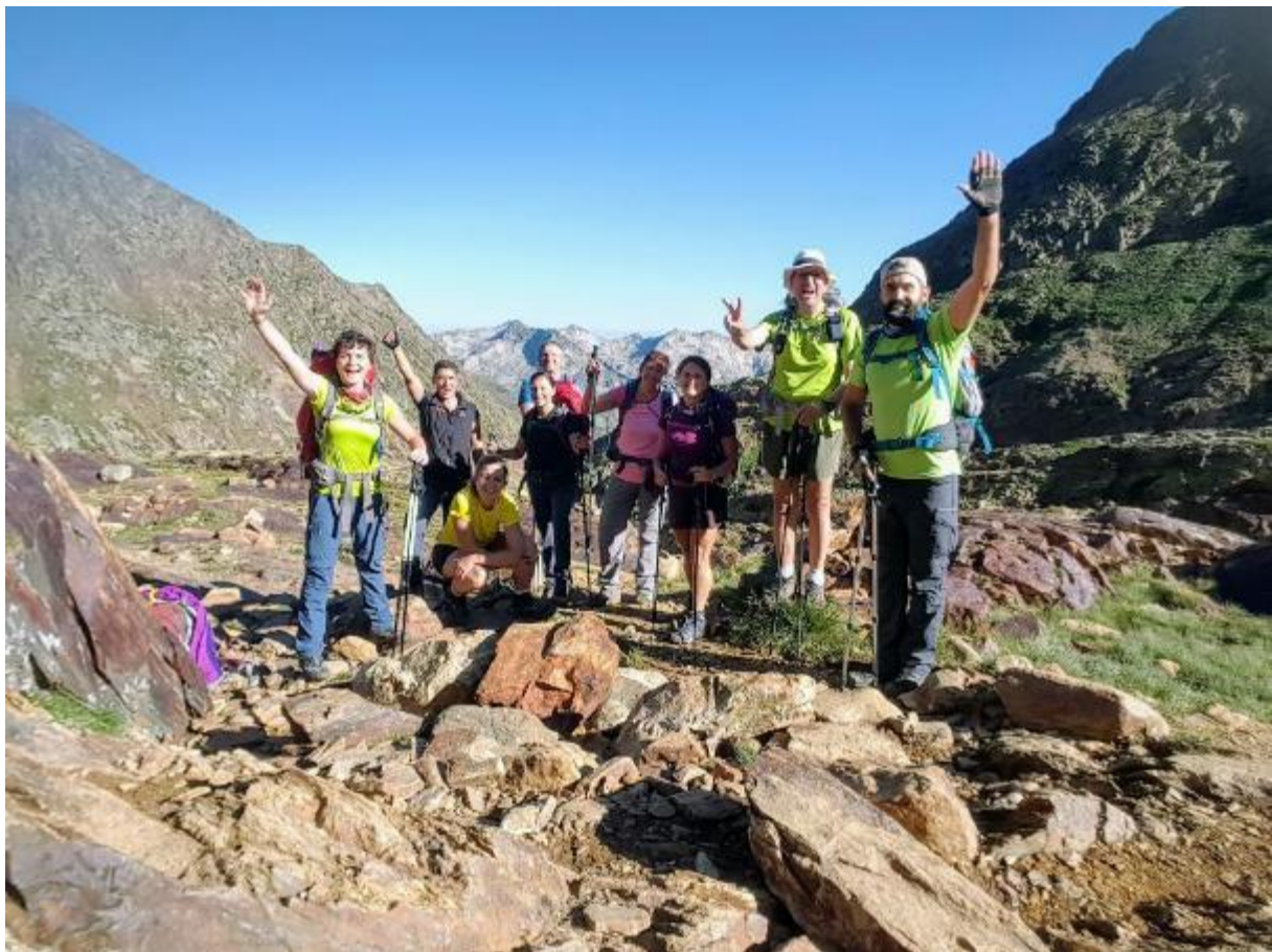
Era broma !