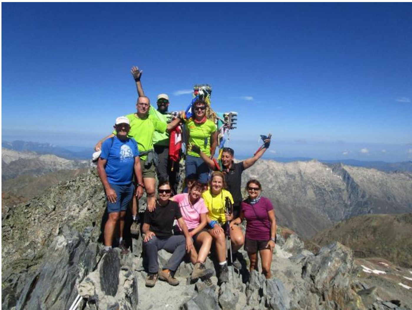
La pica d'Estats en majúscules