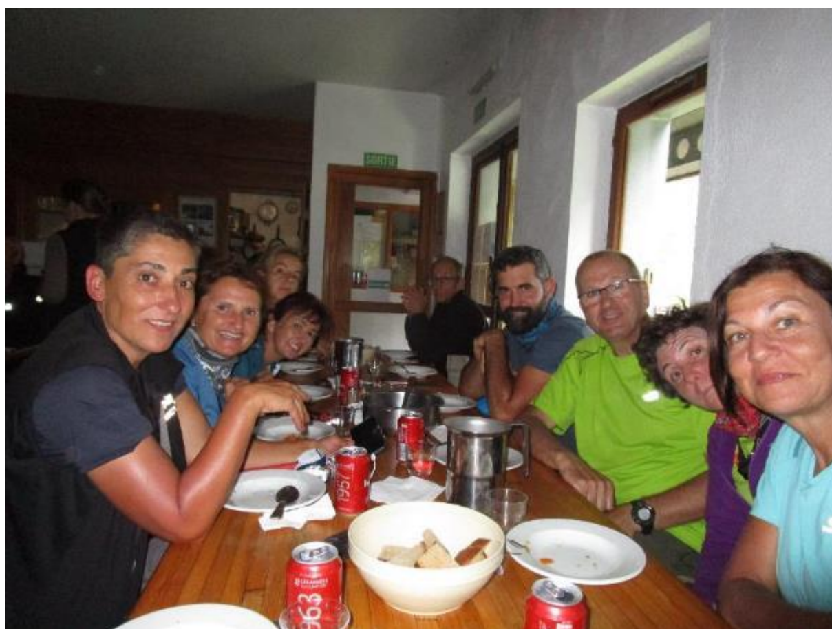
Un peu de soupe s'il vous plaît!