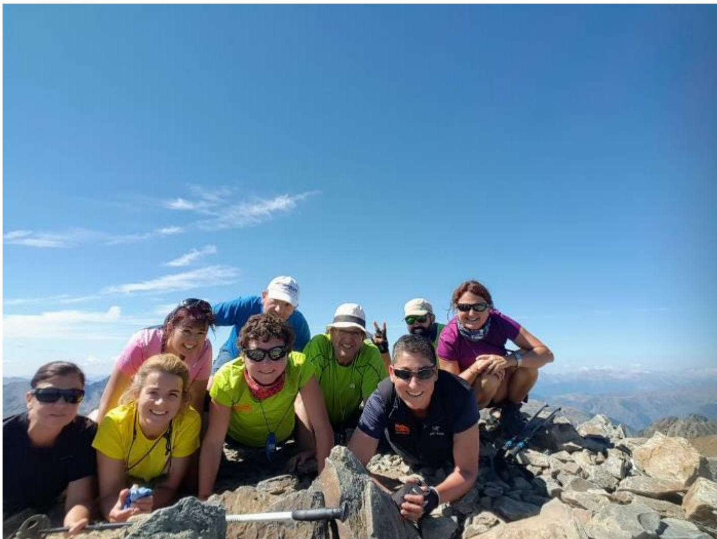
Cim del Verdaguer