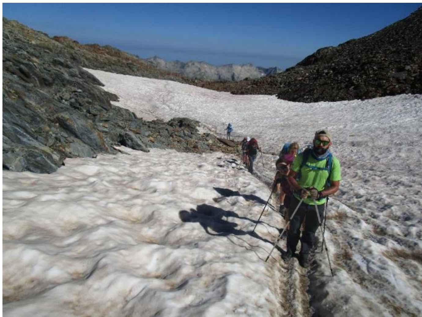
Una petita glacera...Aquí ja s'ensuma cosa bona !!!