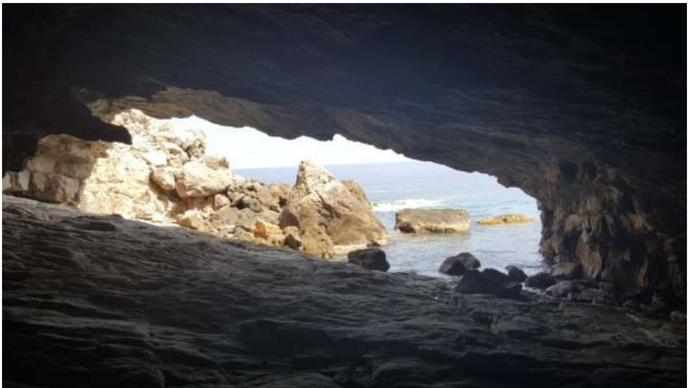
Na Bernarda: una finestra al mar