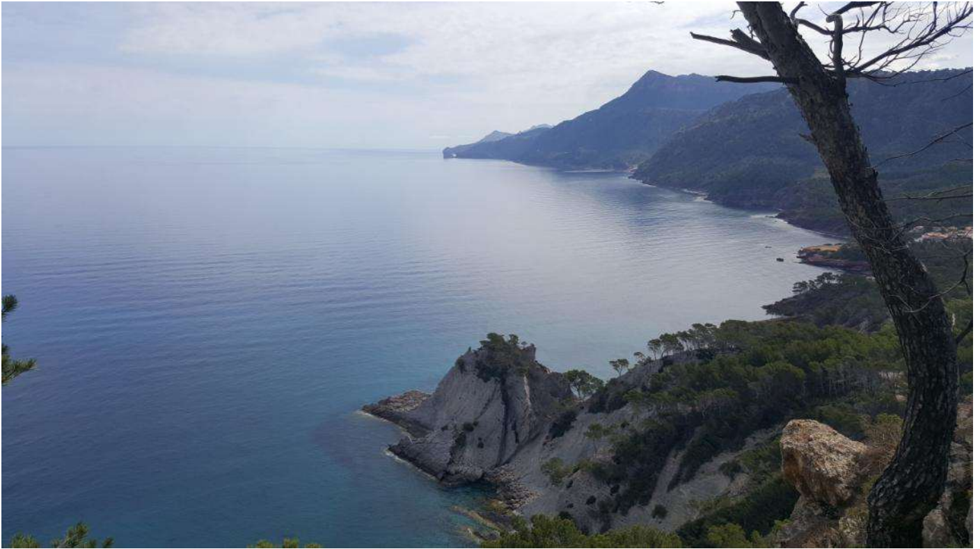
Sa Punta de l'Aliga des de dalt des Corral Fals

El bosquet de la part des Saragall és un oasi petitó de silenci i natura