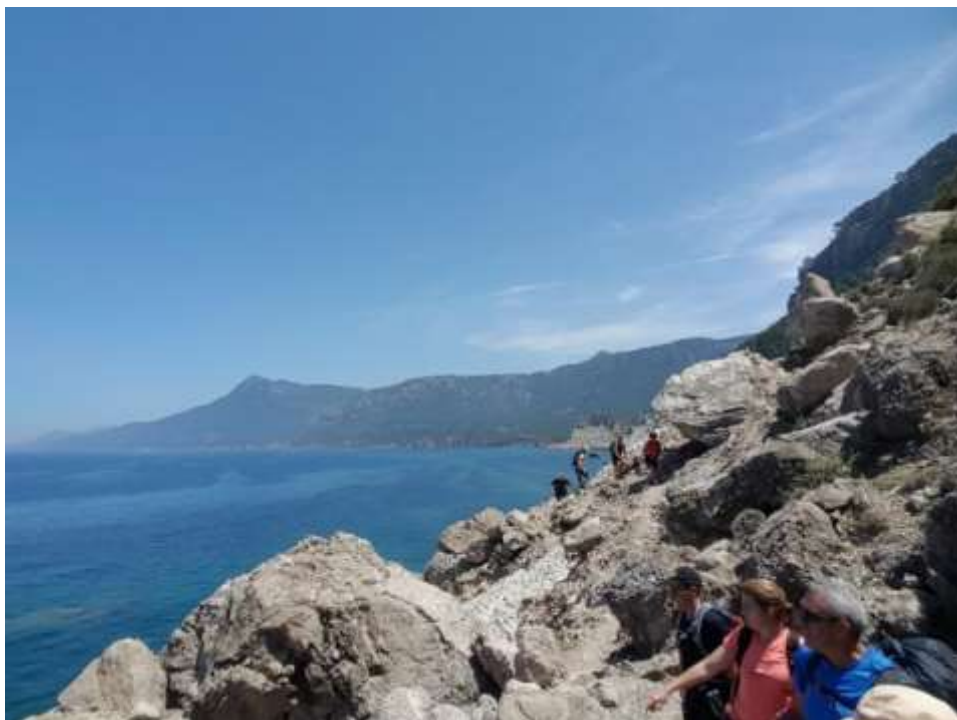
Comença la tornada