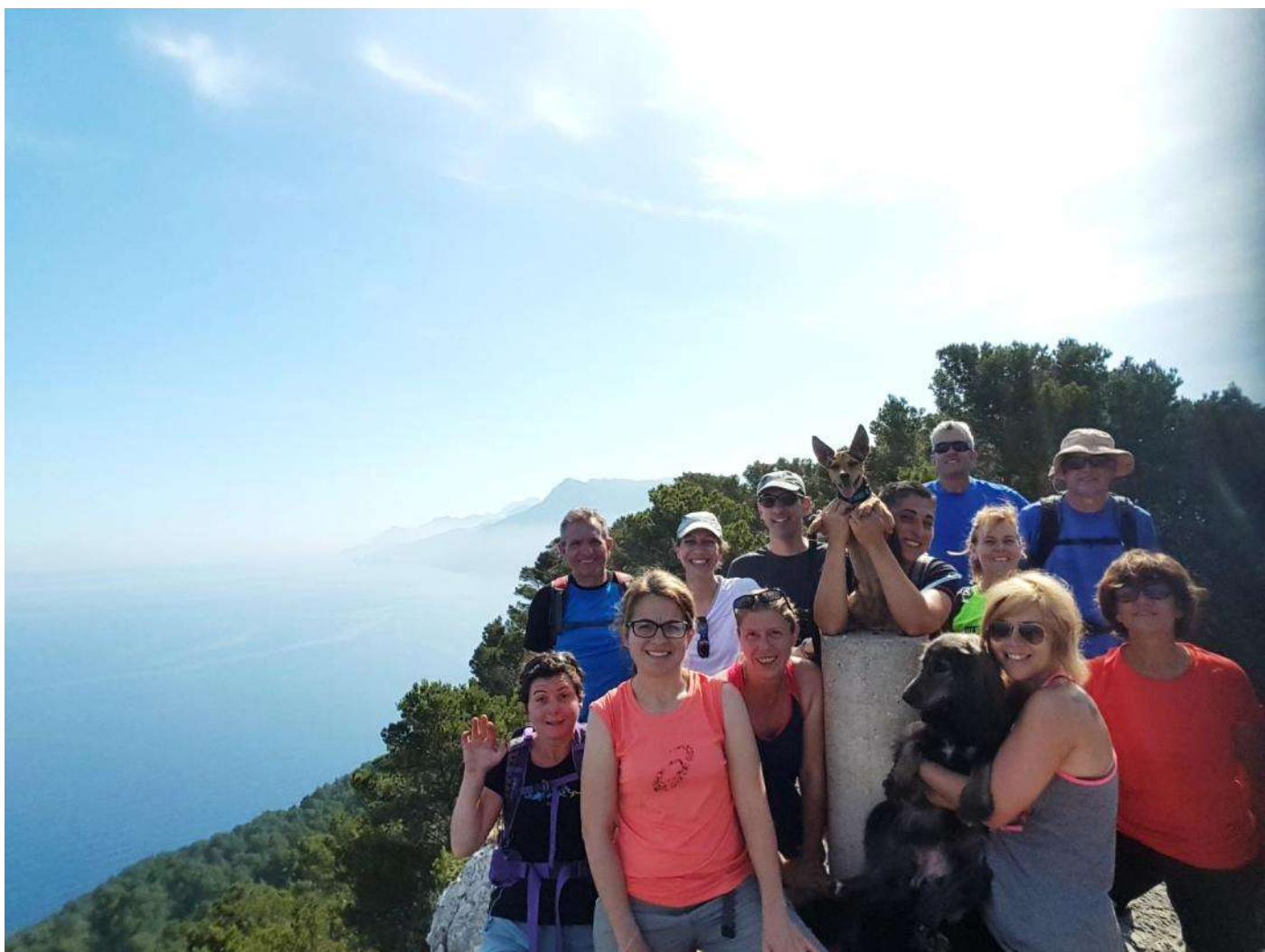
El puig de ses Planes