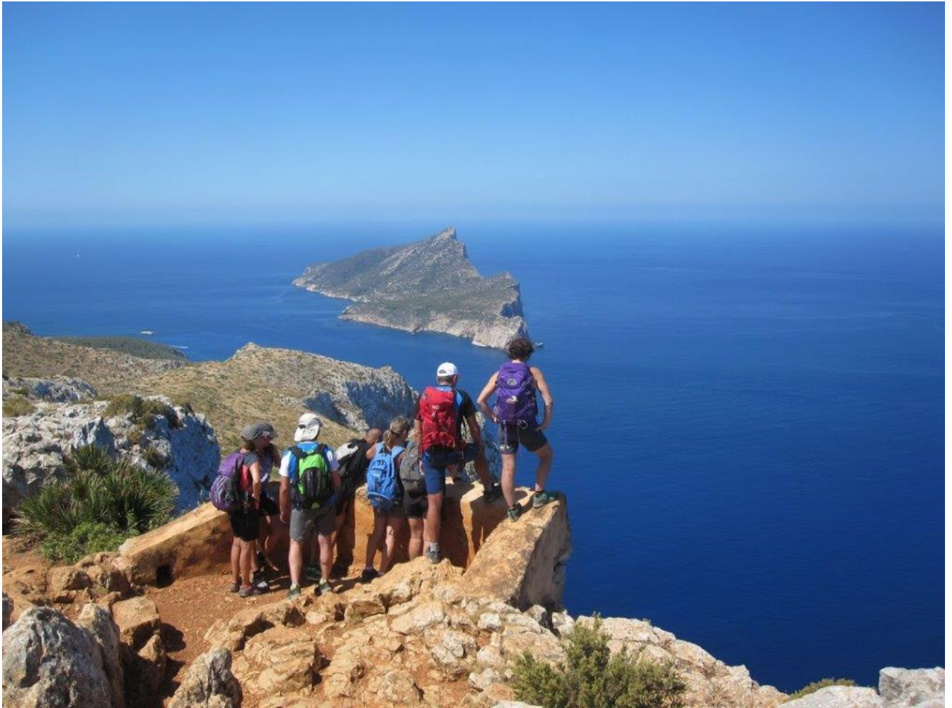
Arribàrem al mirador del cap Fabioler: tot un Espectacle !!!