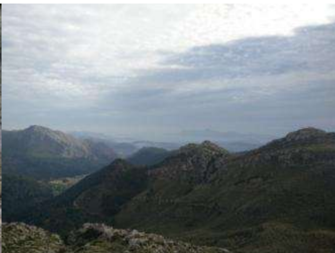
Pujàrem al Paraigo i el dia ens regalà les primeres vistes de mar i muntanya

Continuàrem el camí en direcció nord per un roquissar gris vingut des Puig d'Esbaldragat que en moltes ocasions dóna l'aspecte d'arribar a un lloc que ha estat víctima d'un cataclisme, els alens eren espessos, però el lloc bé es valia un bon esforç