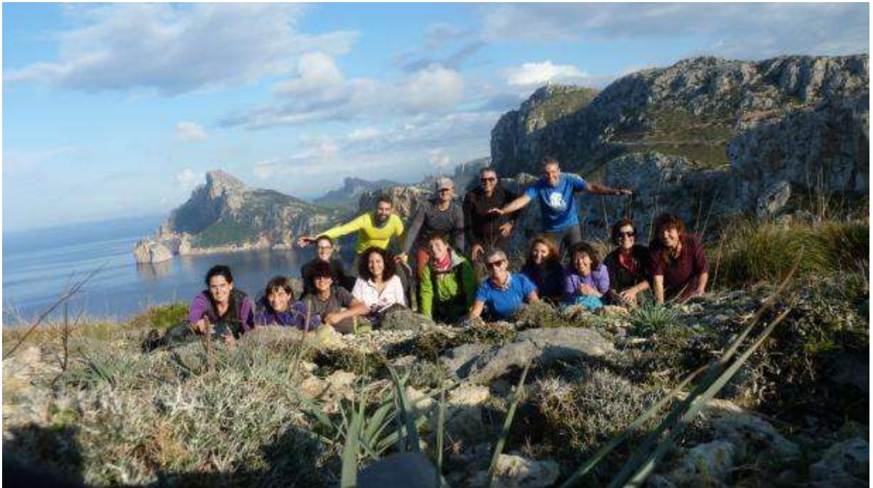
Tota sa Guarda en acabar la primera carena

Nosaltres vàrem fer tota la serra grim pant per la carena la qual cosa li va donar un escaló més de verticalitat i risc, d'aquí el grau de dificultat, de totes maneres si es vol, es pot transitar per la zona evitant la carena.