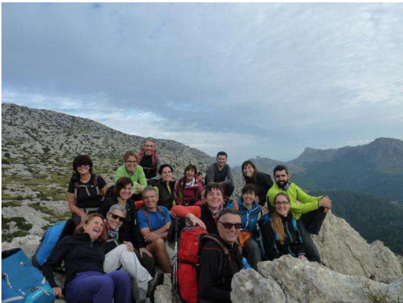
Sa guarda a dalt des Paraigo

Distància :15 km. Dificultat: Moderada-Alta. Requereix esforç a les pujades i seny en transitar pel roquissar, obligant a fer qualche grimpada senzilla. Nosaltres vàrem fer un tram de la tornada grimpant entre dolines la qual cosa demandava especial atenció, però aquest tram, si es vol, és evitable.