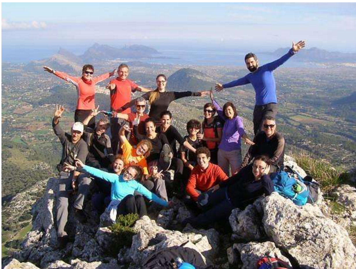
Sa guarda a dalt de sa Cuculla de Fartarix

Vall de Colonya -> Pas de s'Alzinar-> Tossa del Llamp (594 m.)-> Cova des Boc-> Cova Morella-> Casa de la Mola-> Cuculla de Fartarix-> Pas de sa Moleta-> L'Asserell-> Vall de Colonya