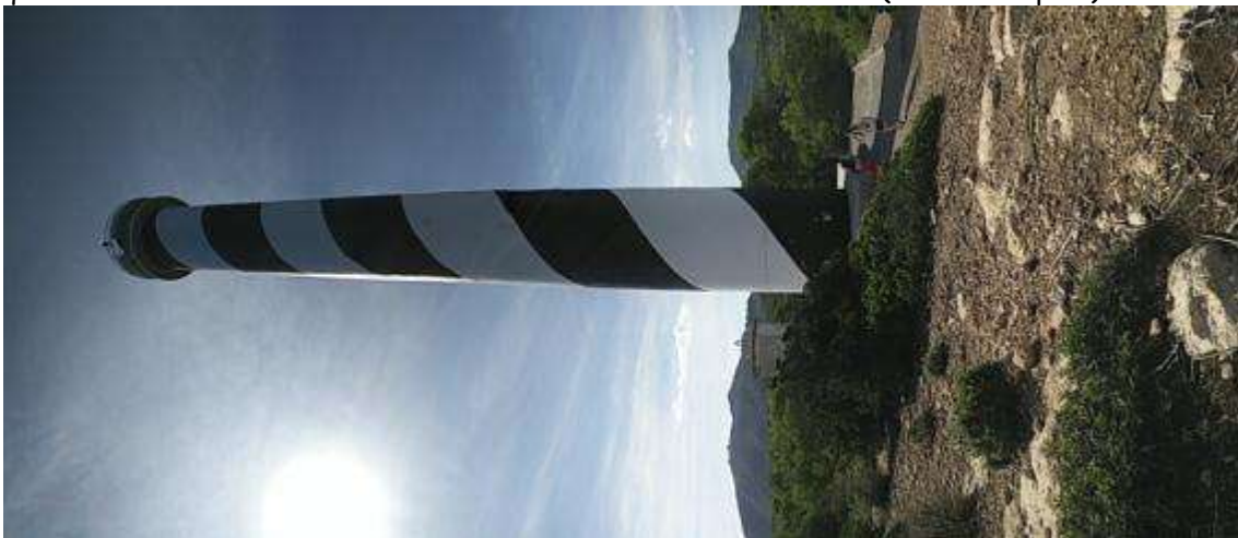
Una foto de través perquè ... bé... perquè som un poc ... .. ejem... diferents !!!

Una vegada arribats al far de Moscater podem admirar la seva gran alçada i majestuositat que sembla voler tocar el cel amb un llum... són 52 metres de far (tot un olímpic !).