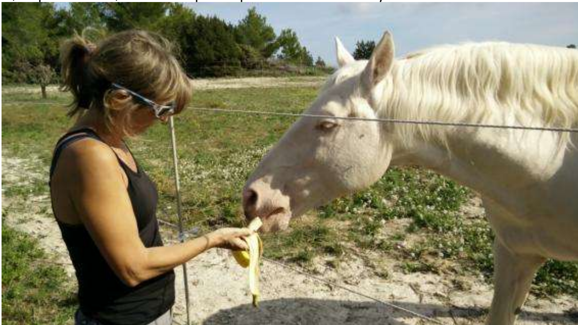
Pel camí trobarem un bon amic ...

A partir d'ara el camí transcorre entre finques i sense perdre especialment alçada, agafant sí, un poc de fúria, a l'hora de passar per la zona de ses Penyetes.