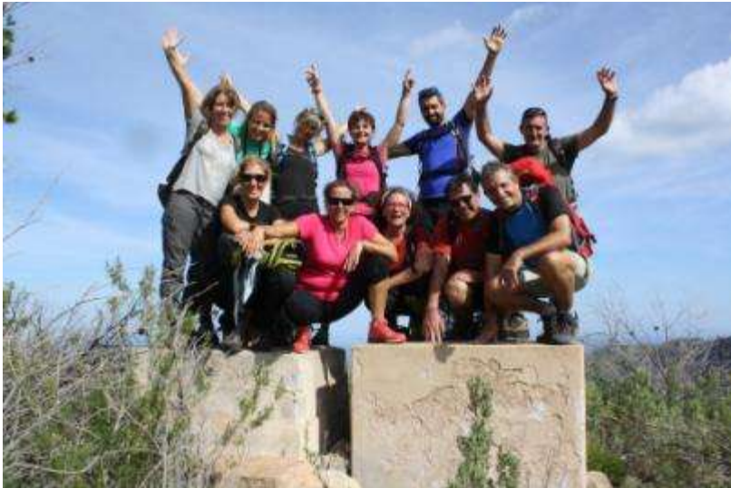
Puig de Rei → Kabreta !!!

A partir d'ara el camí transcorre entre finques i sense perdre especialment alçada, agafant sí, un poc de fúria, a l'hora de passar per la zona de ses Penyetes.