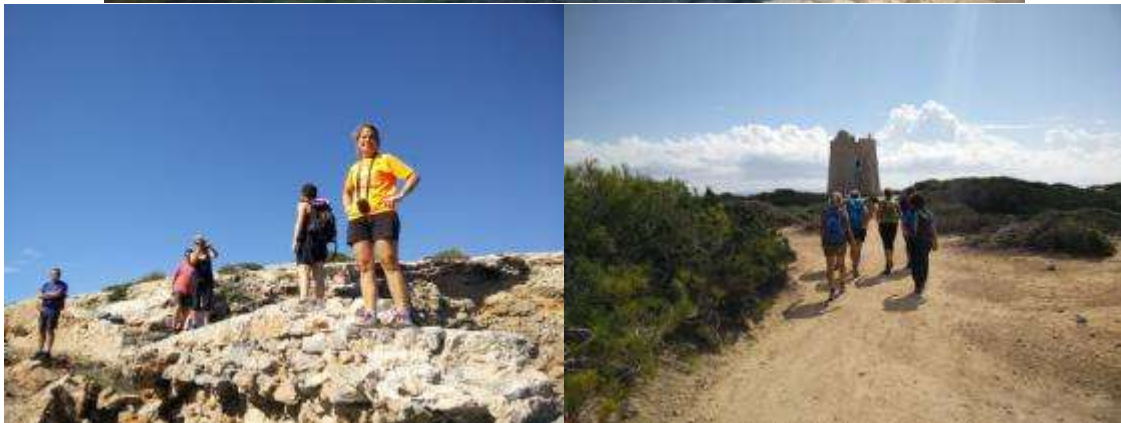
El banyito també va caure molt a prop de sa Torre de ses Portes