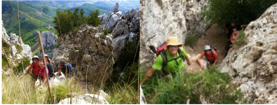
fent el pas