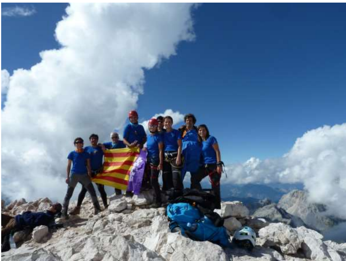
TRIGLAV (2.864 metres) -Alps Julians --> REPTE KABRETA ACONSEGUIT.

Mai sabràs si ho pots fer si no ho proves..., i sols venent la temença de no arribar-hi i atrevint-te al repte, existirà la possibilitat d'arribar allà on tu volies.