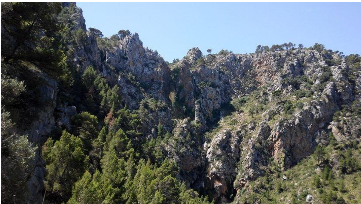
Es salt de Vistamar tot un espectacle