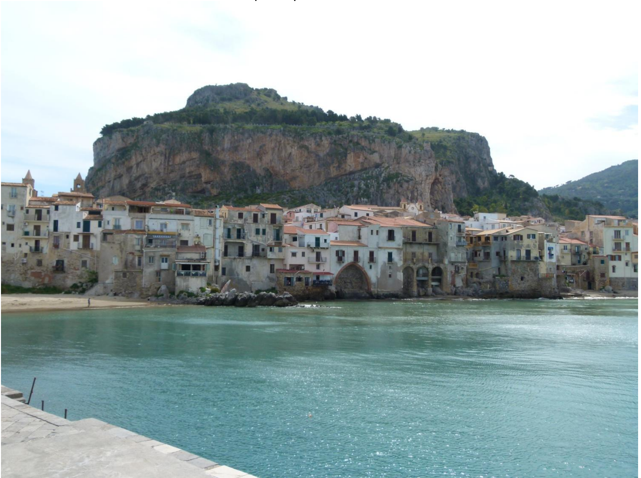
Aquí passejarem: Palerm