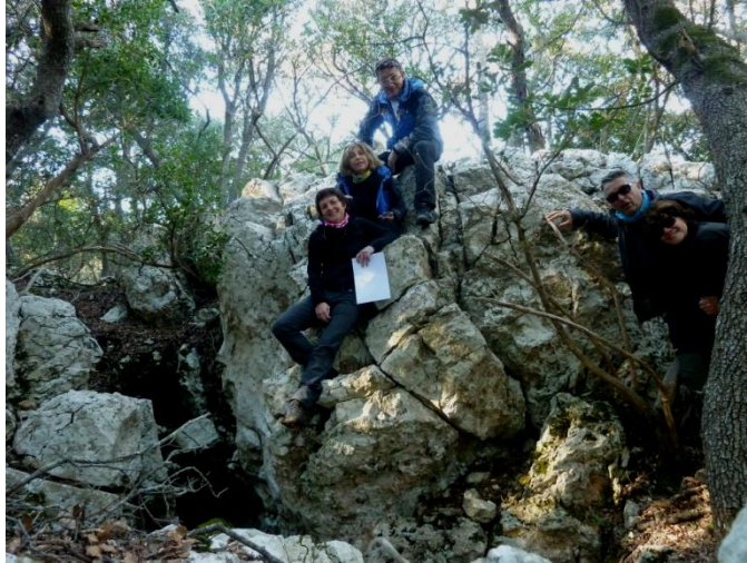
Aprenguérem a situar-nos, a cercar i a trobar

I després de dinar donàrem a conèixer la gran fita del dia als participants: " si voleu dormir calents haureu de ser vosaltres qui trobeu on hem de dormir avui... !!! "