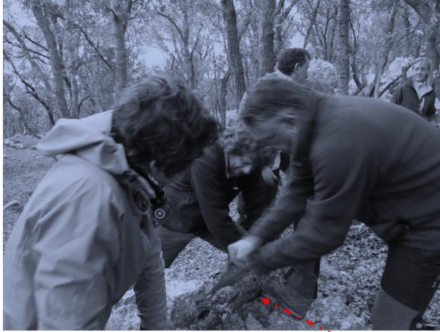
Títol de la pel·lícula: " En busca del fuego "