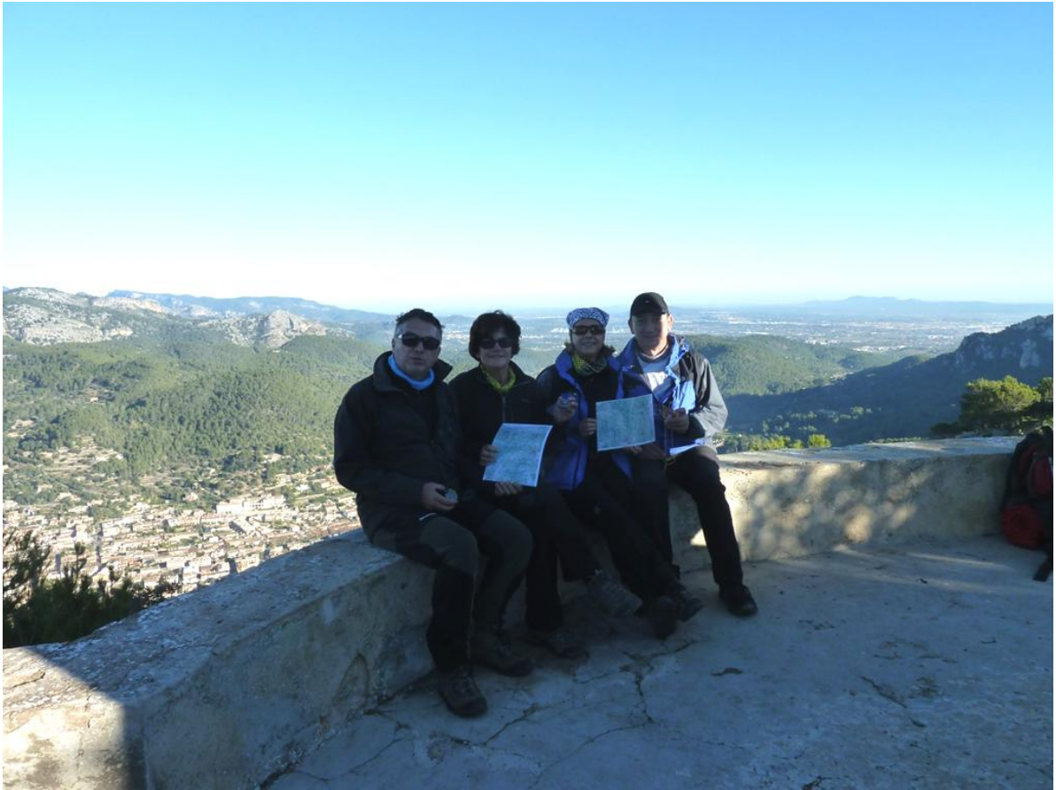
LA GUARDA ORIENTADA SENCERA...