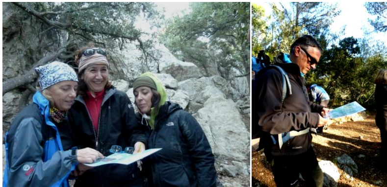
Uns alumnes aplicats...

Per començar aprenguérem els conceptes bàsics dels instruments a emprar: mapa i brúixola.