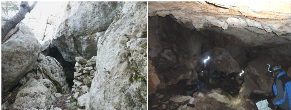
I tot i que no era fàcil demostraren que havien après de valent "Vat aquí la cova dels Ermassets"

I després de dinar donàrem a conèixer la gran fita del dia als participants: " si voleu dormir calents haureu de ser vosaltres qui trobeu on hem de dormir avui... !!! "