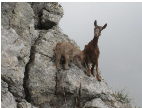
Una de kabretes