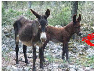
Una de kabretes