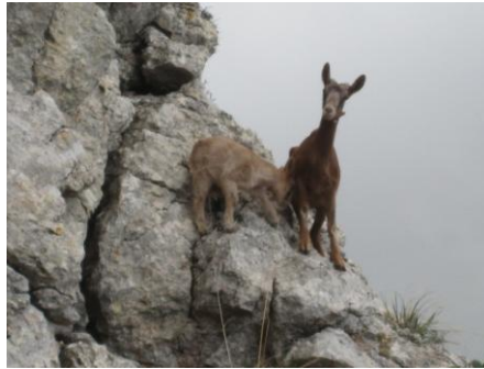
Una de kabretes