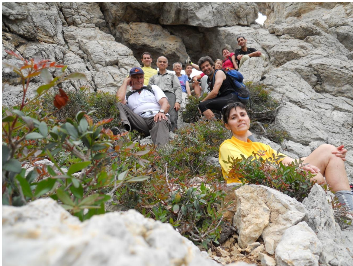
A mitjan camí les cares ja reflectien l'esforç...