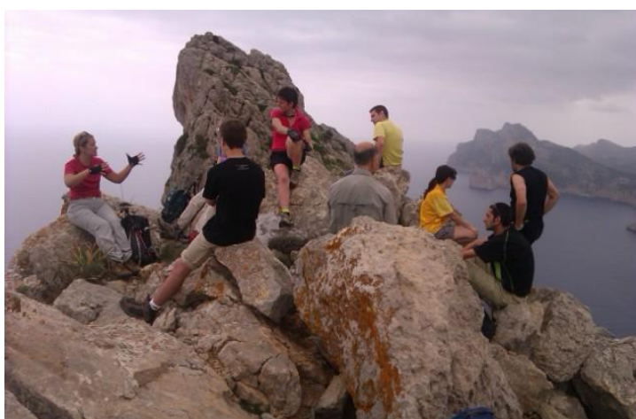
Mentre alguns trobaven la pau, els altres inventaven històries...