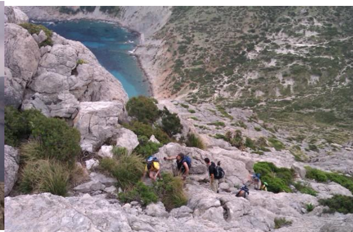
El grup de les kabretes grosses en plena acció