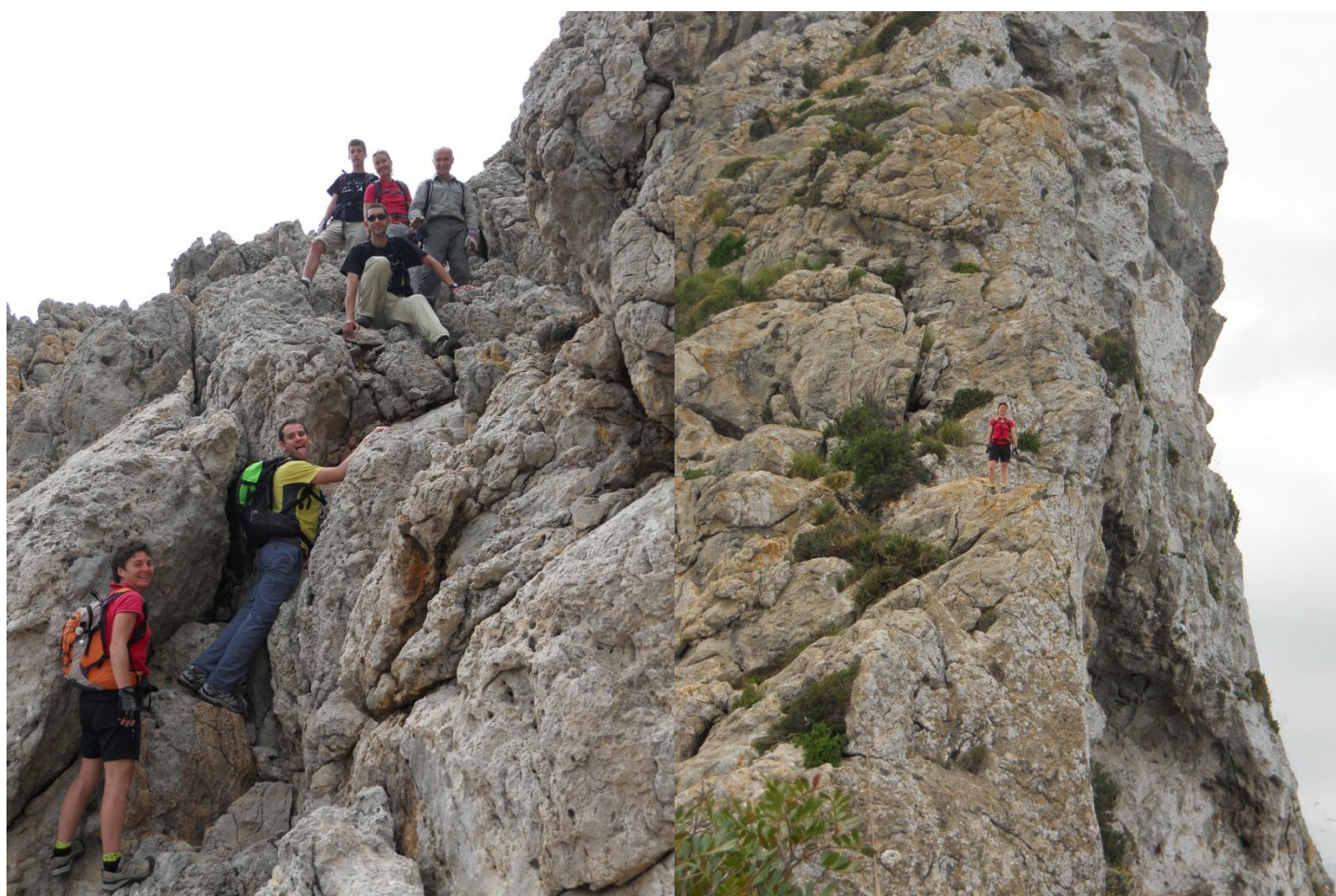
Una davallada kabreta