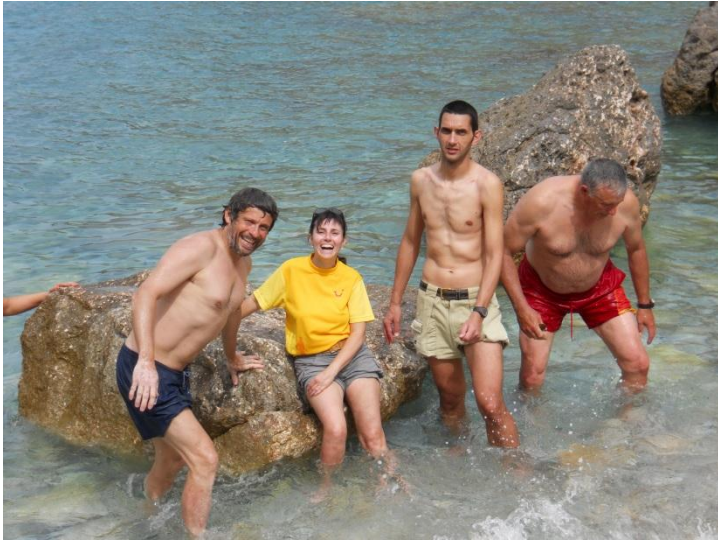
I tot té un premi ! o no...