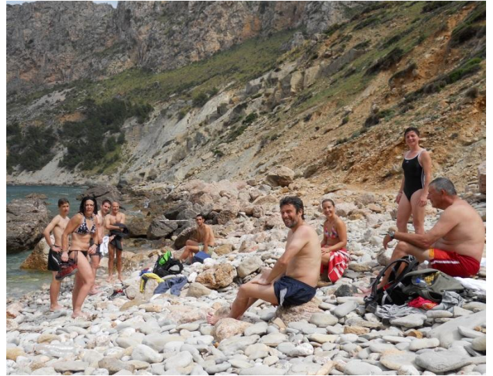
Cala Bòquer es convertí en el millor Spa del món