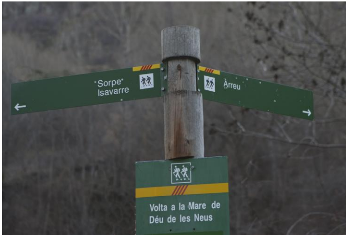
Uuuuuuh !!! que vénen els fantasmes