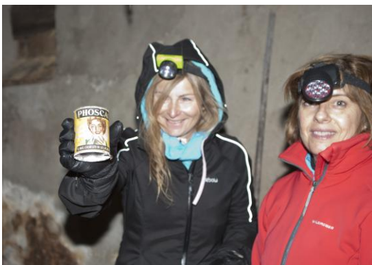
Qui no es llepa els morros???, Phoscao, 12 pessetes