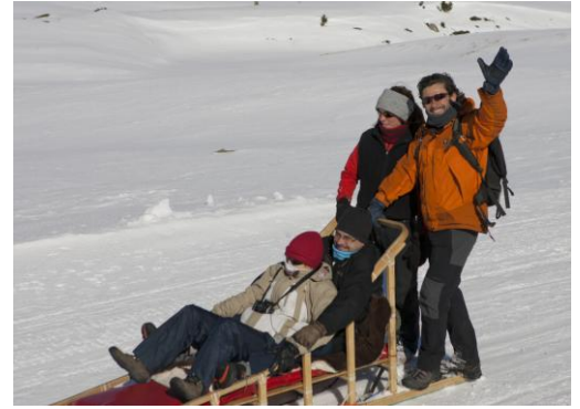
I això és tot