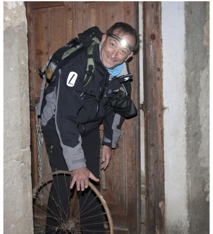
Guau! Això per la bici de n'Ascen serà d'escàndol!!