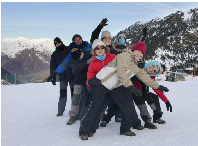
Esclata la festa: NEUUUUU!!!!