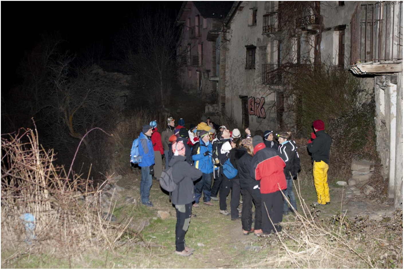
Què??, on són els valents ara???