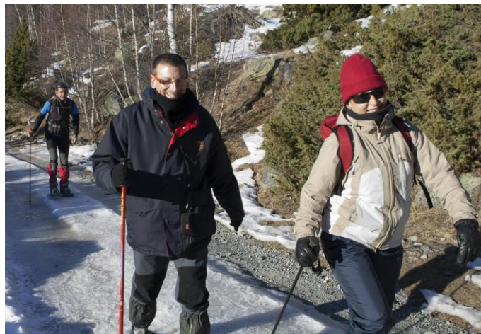
A la recerca de l'estany de la Ratera