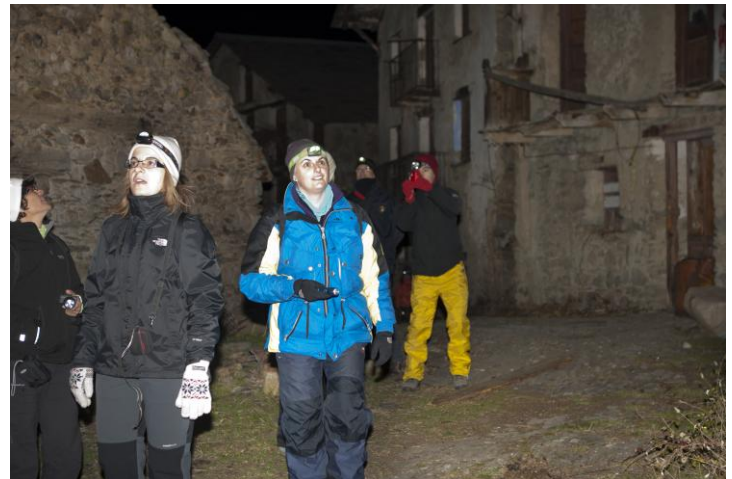
Aaaaahhhh, animals !!!!