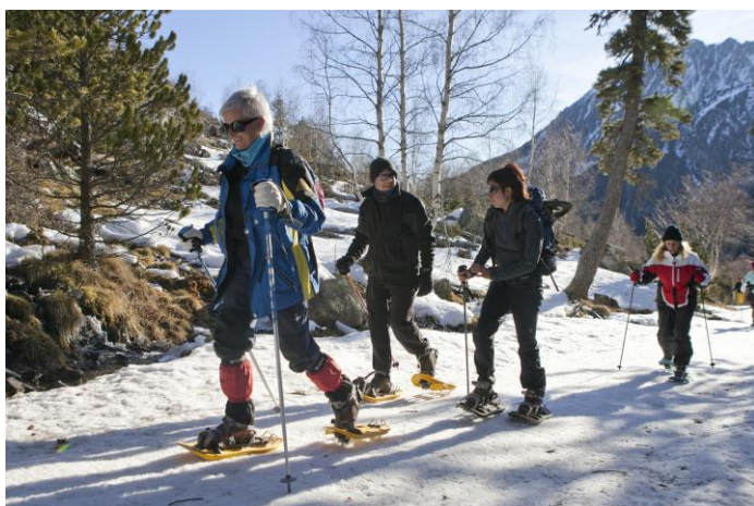
Com autèntics professionals: això?, jo?, a ca nostra... cada dia...