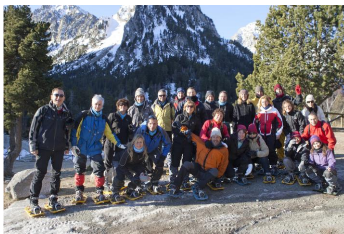
Les kabretes tenen cua??? ... aquestes la remenen !!!!