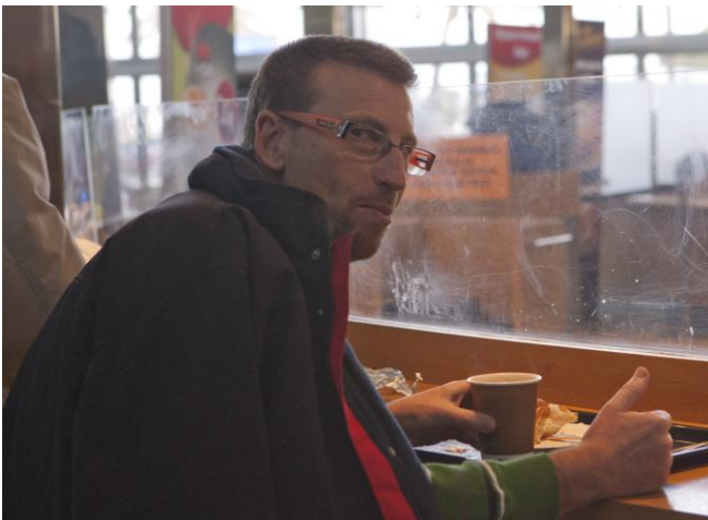
Ejem... Una Kabreta de reüll