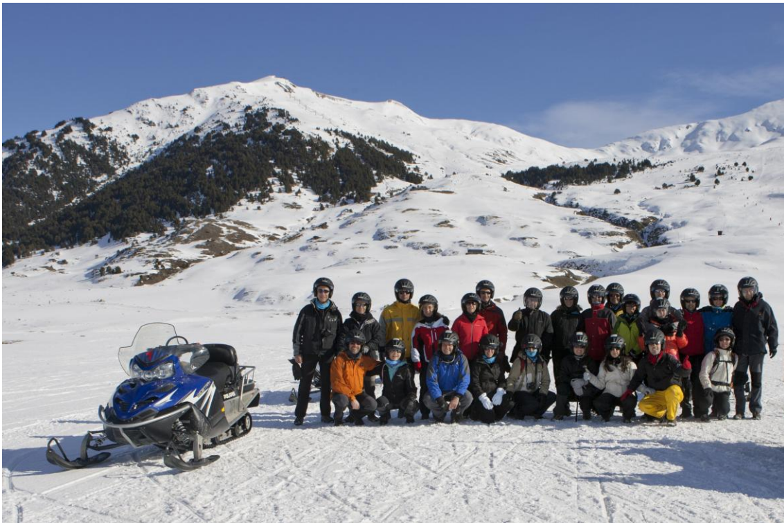
LES KABRETES KALIMERES: pobra moto, no sabia el que li esperava...