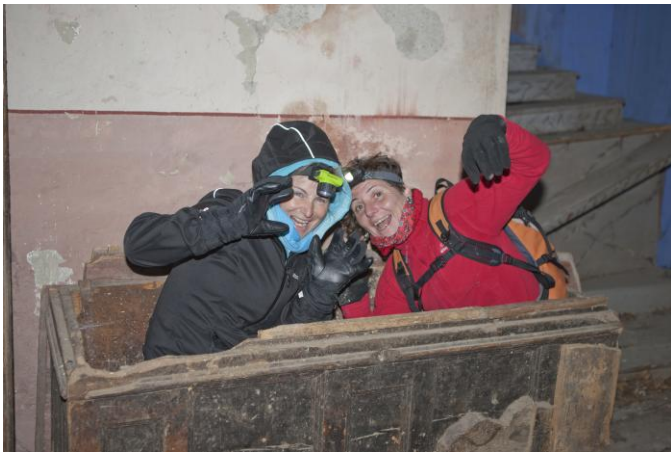
Dues mòmies sortides d'un vell taüt a l'església del poble fantasma d'Arreu