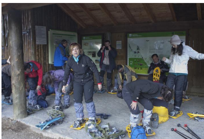
Preparant-se pel ball