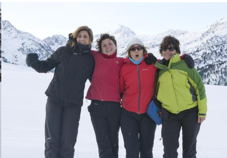
Un estol de Blanquesneus