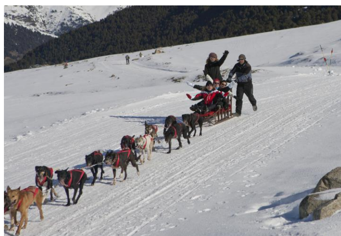
Uns enamorats de riure i de viure