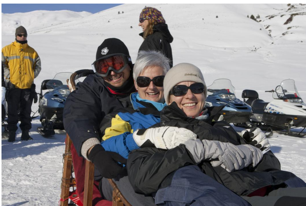
L'emoció es podia ensumar als ulls i les rialles, això si ben fresqueta...