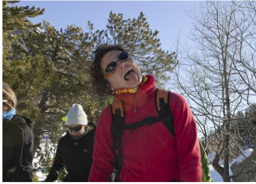
I això és tot