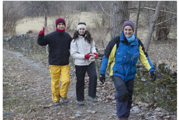
Nooooo!!! Això no són els fantasmes