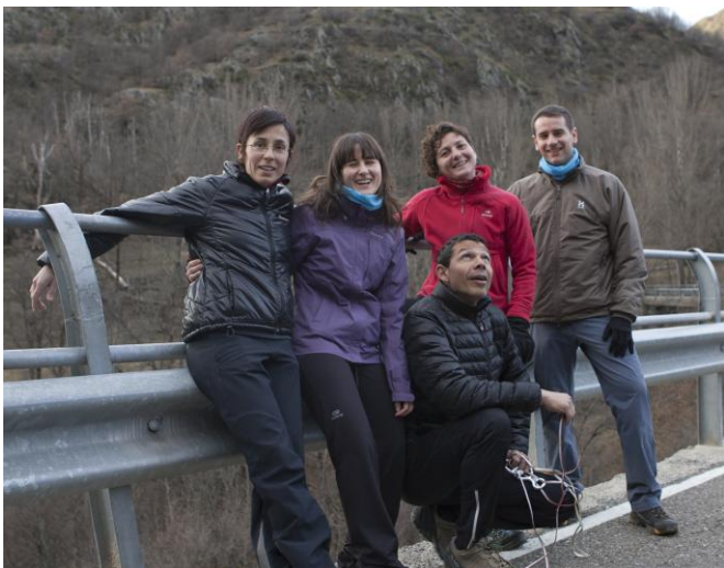
L'equip dels botadors

De cop el guia del davant crida esglaiat: "Qui ve allà al fons?" NINGÜ fan tots a l'uníson, "Com que no???" ..... i ràpid i diligent tragué la seva arma mòbil i.... flash: era VENUS!!!