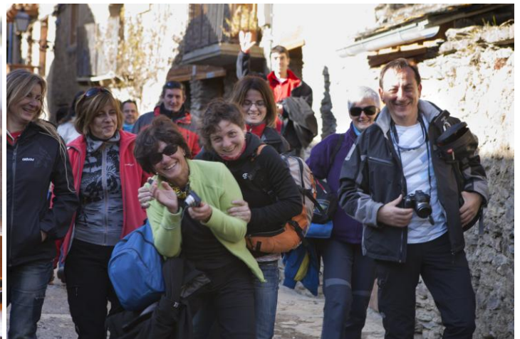
El frontal que no falti: mai es sap!