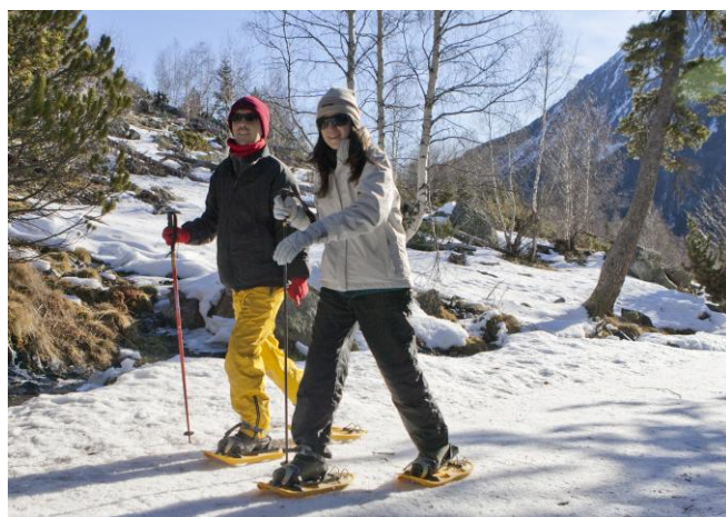
Uns calçons discrets per passar com qui no res