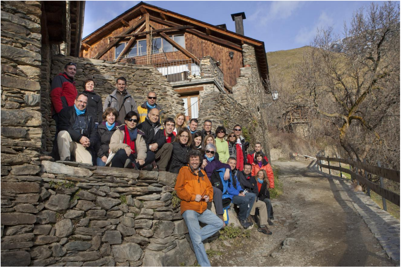
A la formatgeria del Jesus, després del moix i la rata.