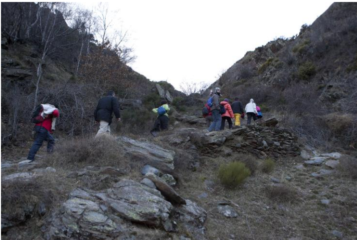
El millor és que se'n refien....